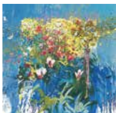
表紙 J. Torrents Lladó ジヴェルニーの花 II